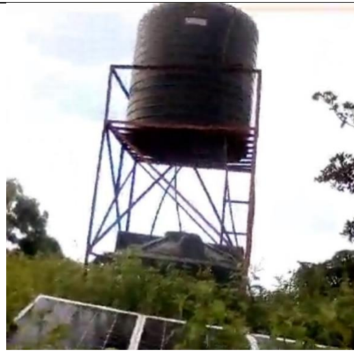
De nieuwe waterpomp en -container.