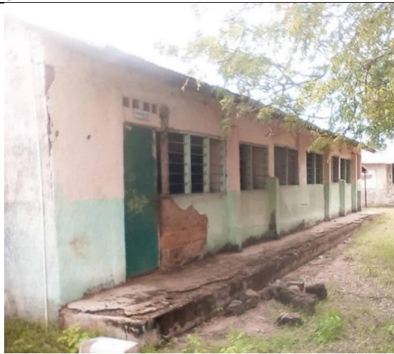
Dringende herstellingen nodig.