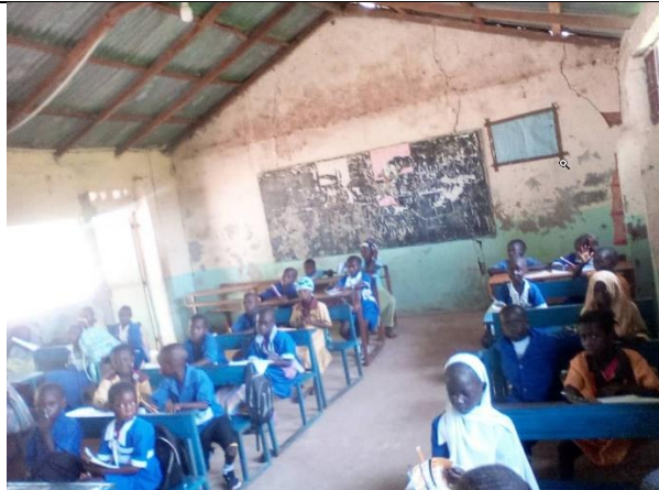
Een van de klassen die dringend moet gerenoveerd worden.