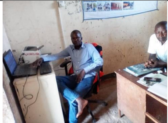
Computers en printer voor de leraars.