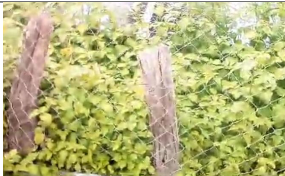
De nieuwe tuinafsluiting.