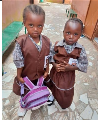
Back to school.