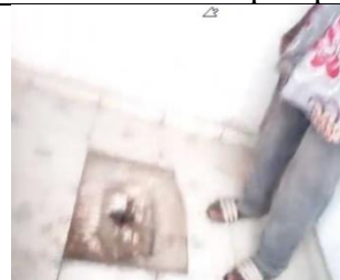
De nieuwe toiletten.