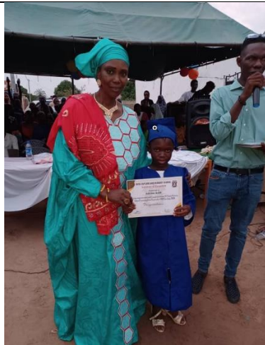
Goede resultaten worden beloofd!